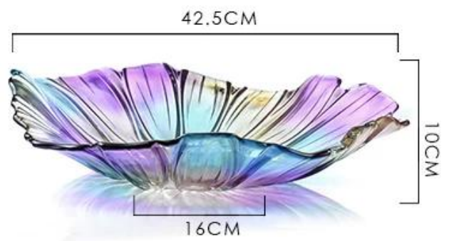
Large glass fruit plate