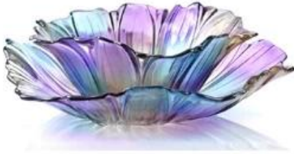
【 Bright 】