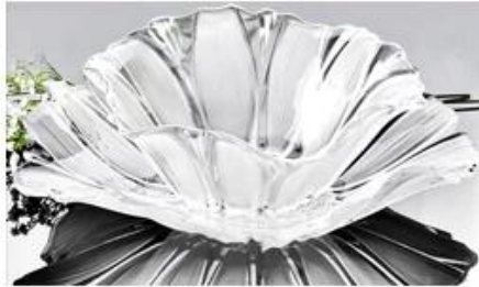
【 Silver 】