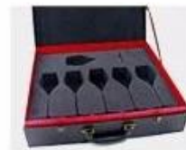
N. Gift Box