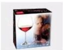
K. Color Box