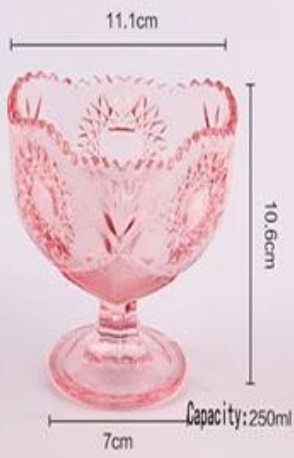
Pink Love Collection