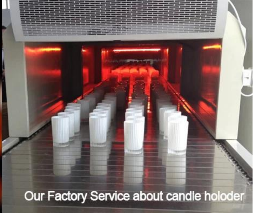
Our Factory Service about candle holder