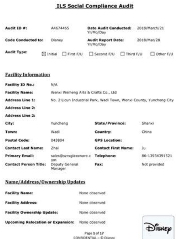
Audit Report revised on Disney