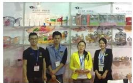
Наша команда продаж: