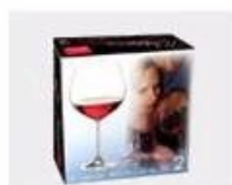
K. Color Box