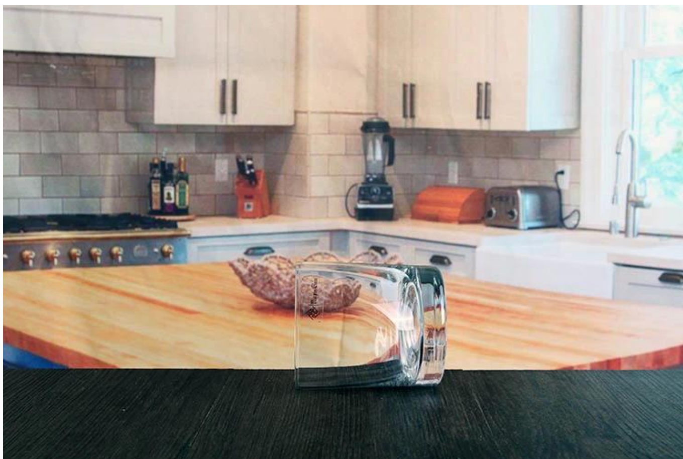
copos de whisky de monograma