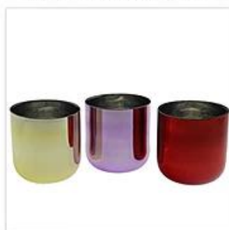
Plated and Painting Glass Candle Holder

Tal como o chinês, personalizado um produto de vela tem muitos processos para sua escolha, cor, logotipo, gravura ou pintura podem ser personalizados.