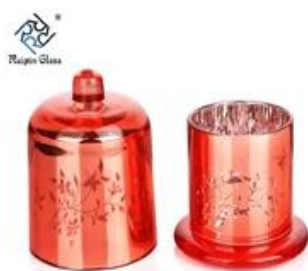
Glass Candle Holders Cheap