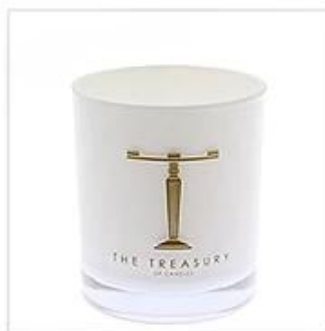
White Glass Candle Holder