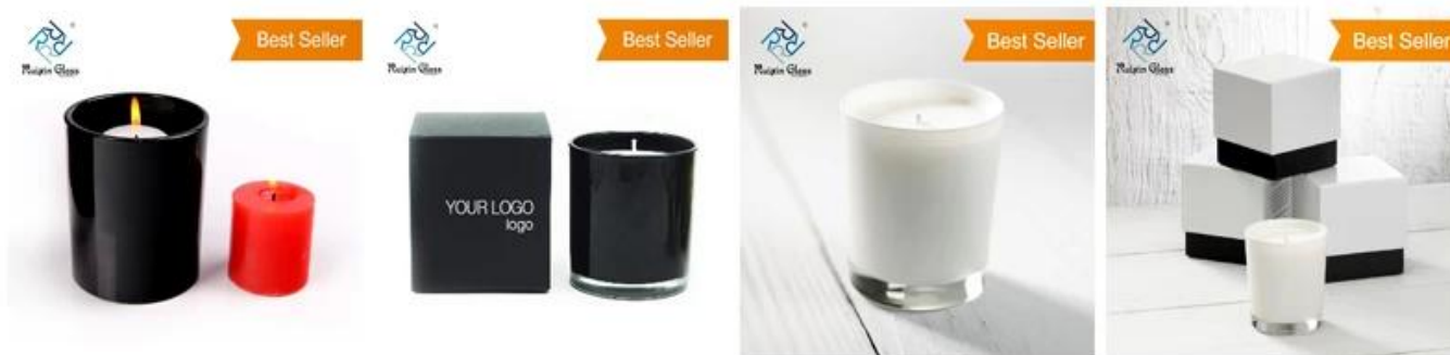
Black candle holders wholesale