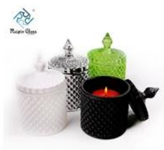
Colored Candle Jar With Lid