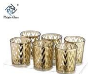
6pcs Votive Candle Holders Wedding