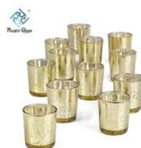
Factory Price Candle Holder 12pcs