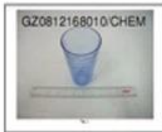
SGS Reference No.: 16100000000000000000 17 Oct 2014