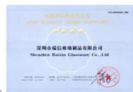
Quality Supplier Membership Certificate