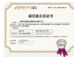
Alibaba TrustPass Membership Certificate