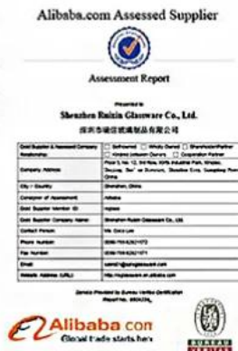
BV Verify factory