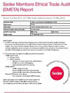
Sedex Verify factory certificate