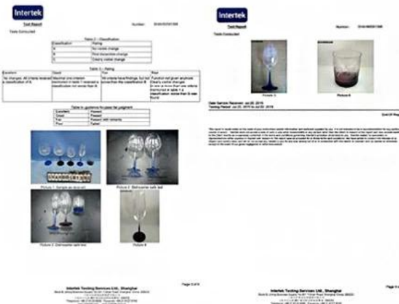
Spray glass cup dishwasher test report