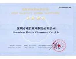
Quality Supplier Membership Certificate