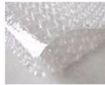
C. Bubble paper