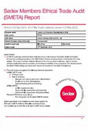
Sedex Verify factory certificate