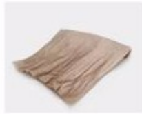
B. Corrugated paper