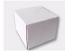
J. White Box