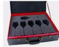
N. Gift Box