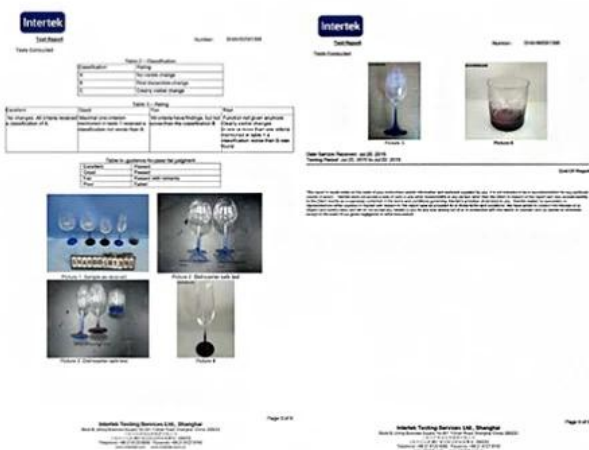
Spray glass cup dishwasher test report