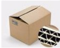
H. Seven layer Corrugated paper master carton