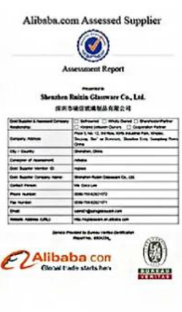
BV Verify factory