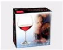
K. Color Box