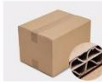
G. Five layer Corrugated paper master carton