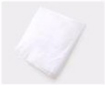
A. White paper