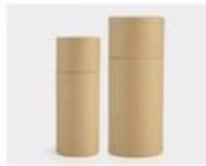
L. Paper Sleeve