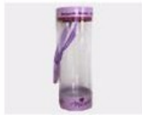
M. Pvc Box