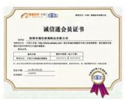
Alibaba TrustPass Membership Certificate