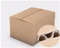
F. Three layer Corrugated paper master carton