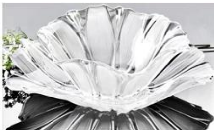
【 Silver 】