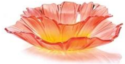
【 Red 】