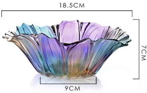
Small glass fruit bowl