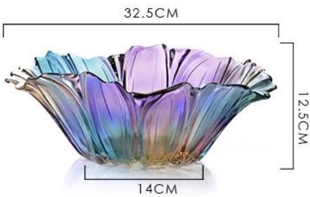
Large glass fruit bowl