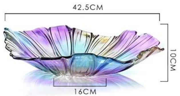
Large glass fruit plate