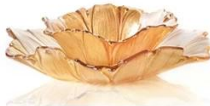
【 Gold 】