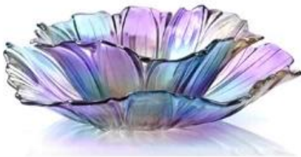
【 Bright 】