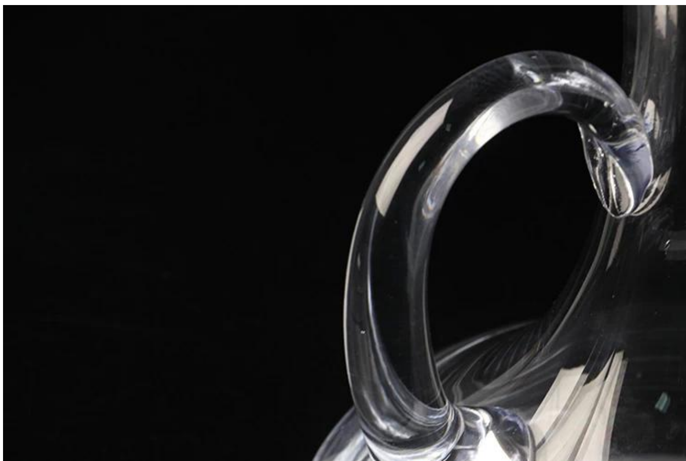
Crystal wijn Karaf met handvat