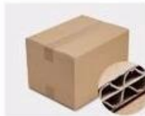
G.Five layer Corrugated paper master carton