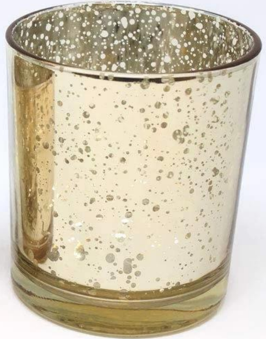
4" gold votive