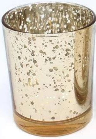
2.75" gold votive