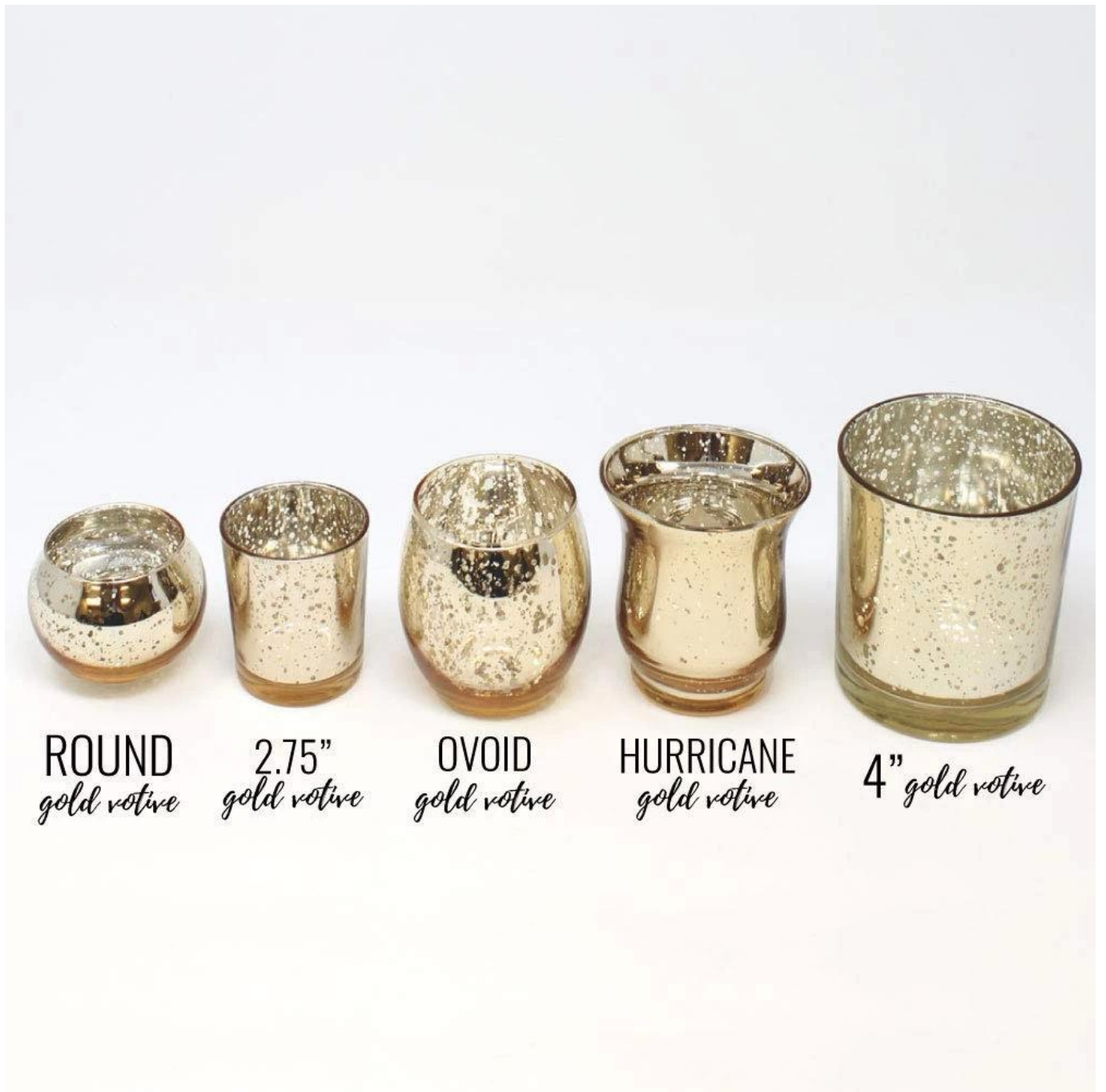
ROUND gold votive