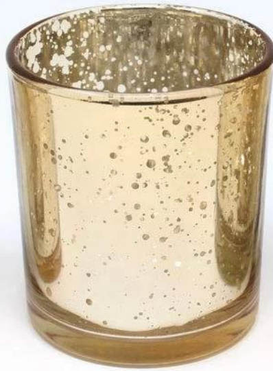
3" gold votive