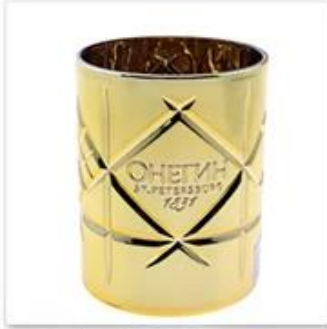
Golden Plated Glass Candle Holder