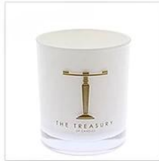
White Glass Candle Holder