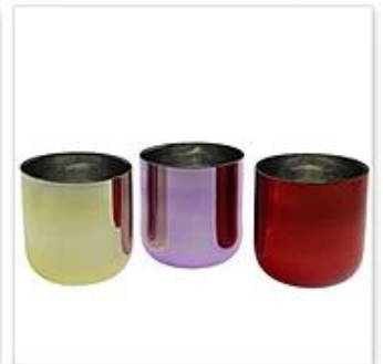
Plated and Painting Glass Candle Holder