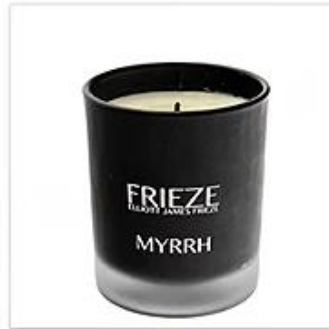
Black Frosted Glass Candle Holder