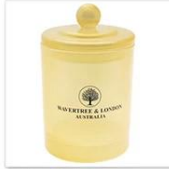
Glass Candle Jar