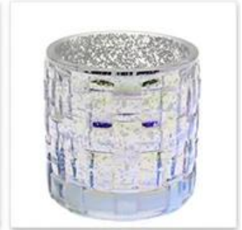
Glass Candle Holder with Hollow Plated and Colorful