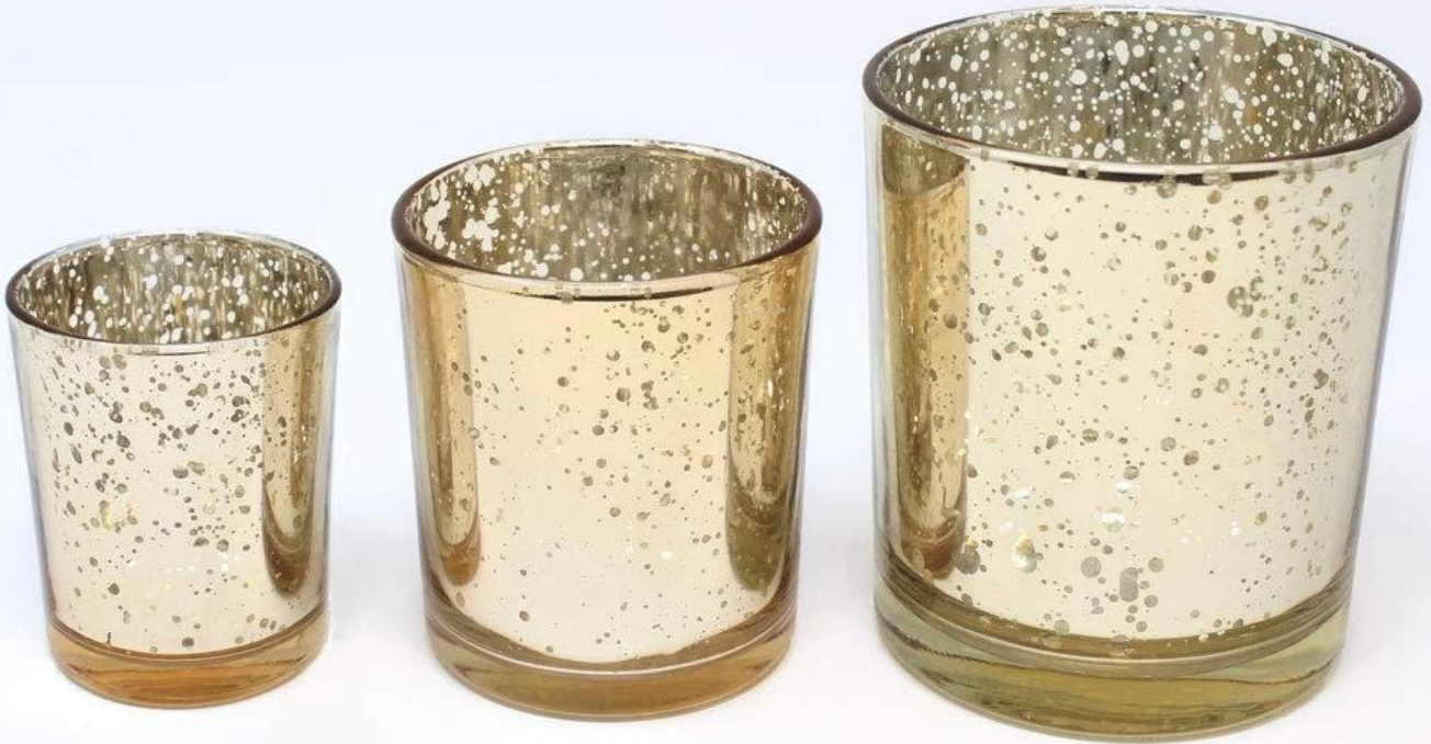
2.75" gold votive