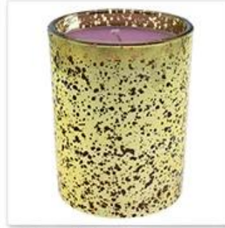
Hollow Golden Plated Glass Candle Holder