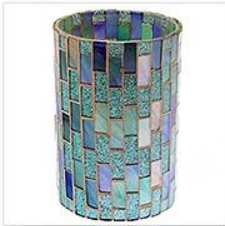
Mosaic Glass Candle Holder