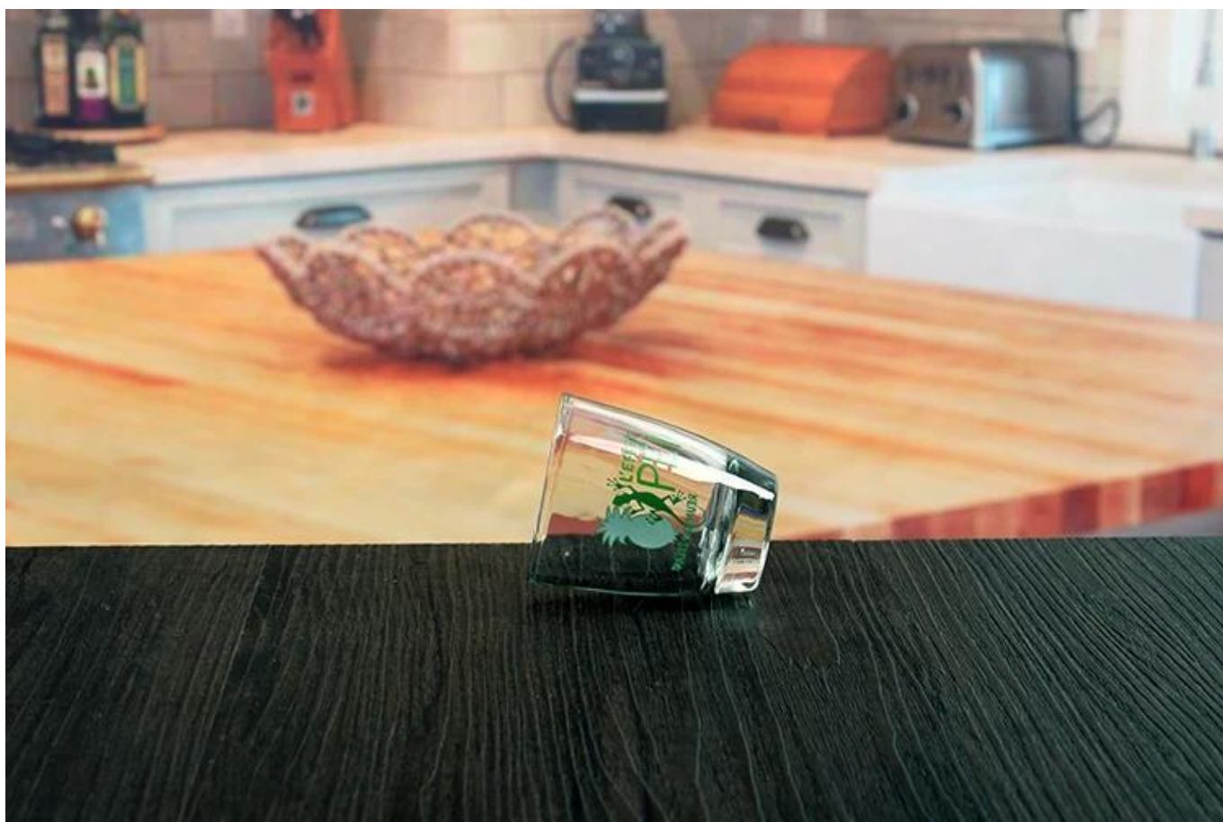
1,5 once girato divertente set di bicchieri