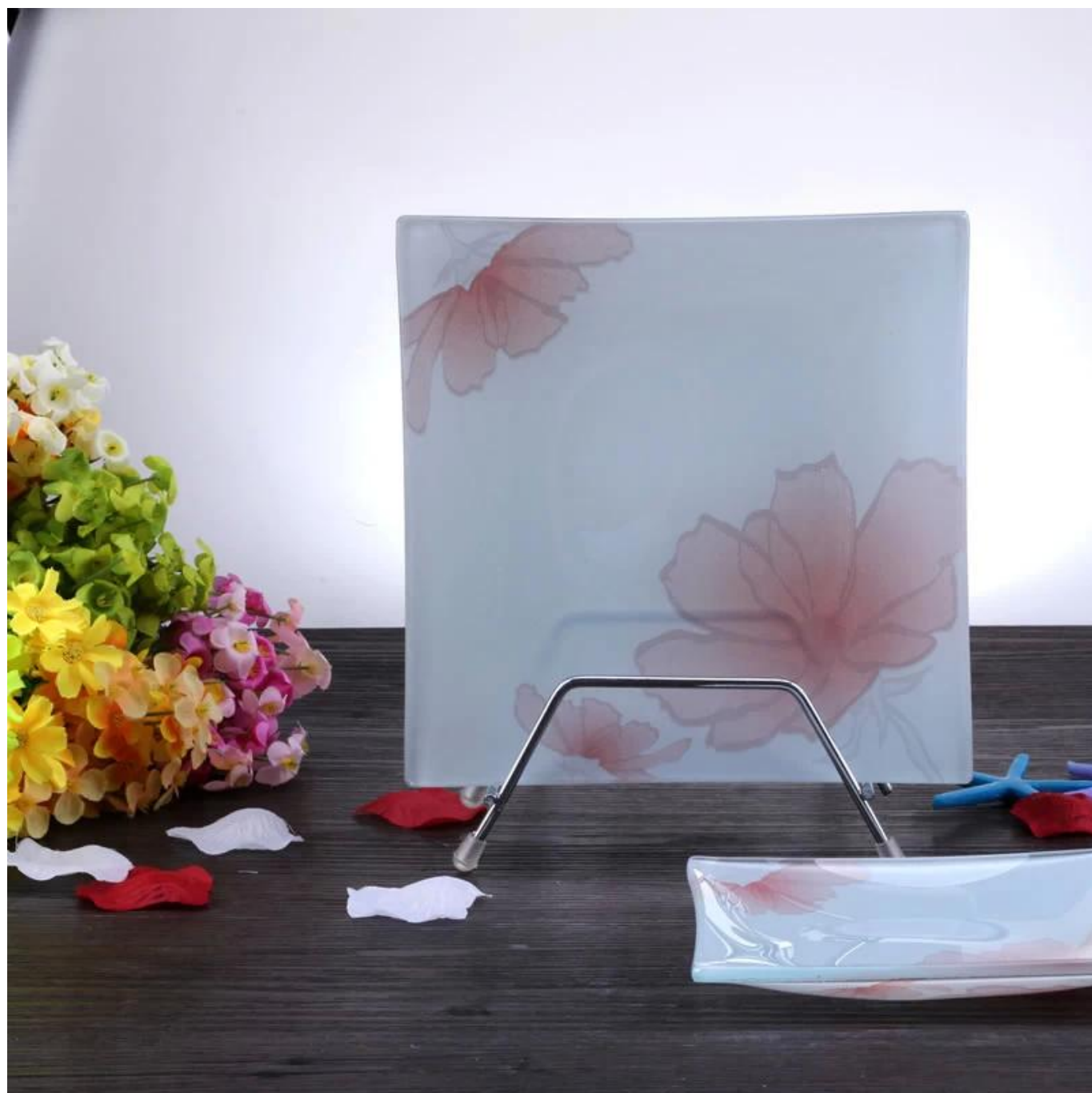
Lastra di vetro bianco Foto: