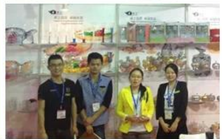
Il nostro team di vendita: