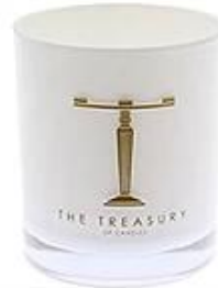
White Glass Candle Holder