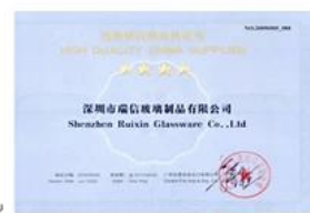
Quality Supplier Membership Certificate