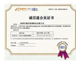
Alibaba TrustPass Membership Certificate