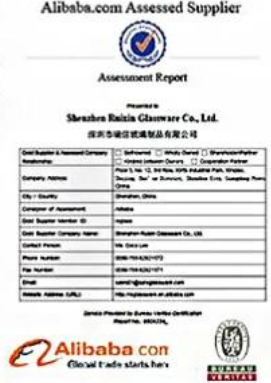
BV Verify factory