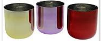
Plated and Painting Glass Candle Holder