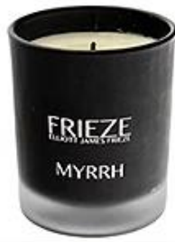
Black Frosted Glass Candle Holder