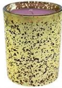
Hollow Golden Plated Glass Candle Holder