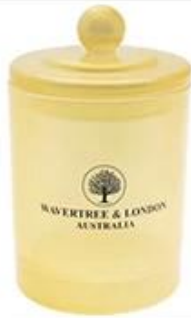
Glass Candle Jar