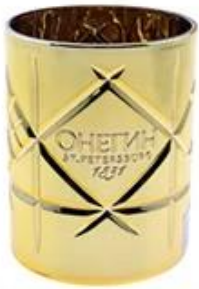
Golden Plated Glass Candle Holder