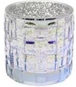
Glass Candle Holder with Hollow Plated and Colorful