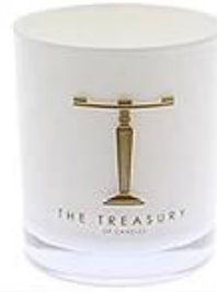
White Glass Candle Holder