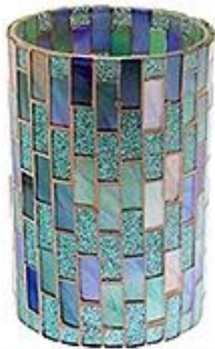
Mosaic Glass Candle Holder