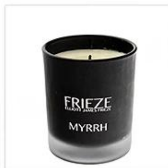
Black Frosted Glass Candle Holder