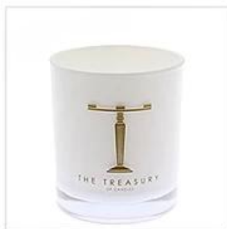
White Glass Candle Holder