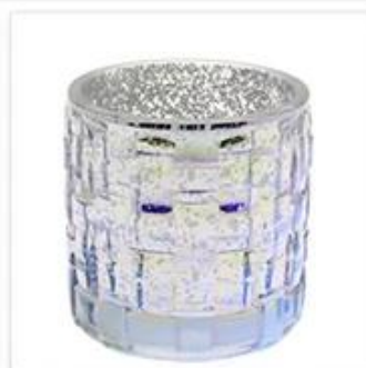
Glass Candle Holder with Hollow Plated and Colorful