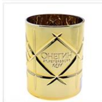
Golden Plated Glass Candle Holder