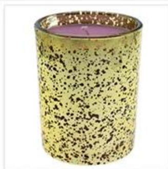
Hollow Golden Plated Glass Candle Holder