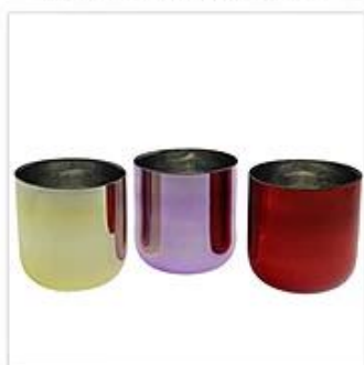
Plated and Painting Glass Candle Holder

Tels que le chinois, la coutume d'un produit de bougie a de nombreux processus pour votre choix, la couleur, le logo, la gravure, ou la peinture peuvent être personnalisés.