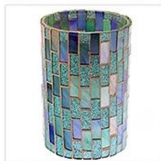
Mosaic Glass Candle Holder