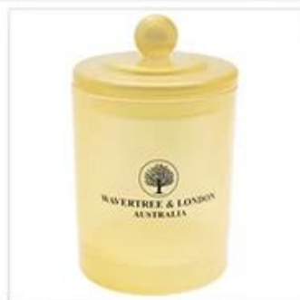
Glass Candle Jar