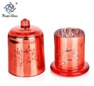
Glass Candle Holders Cheap