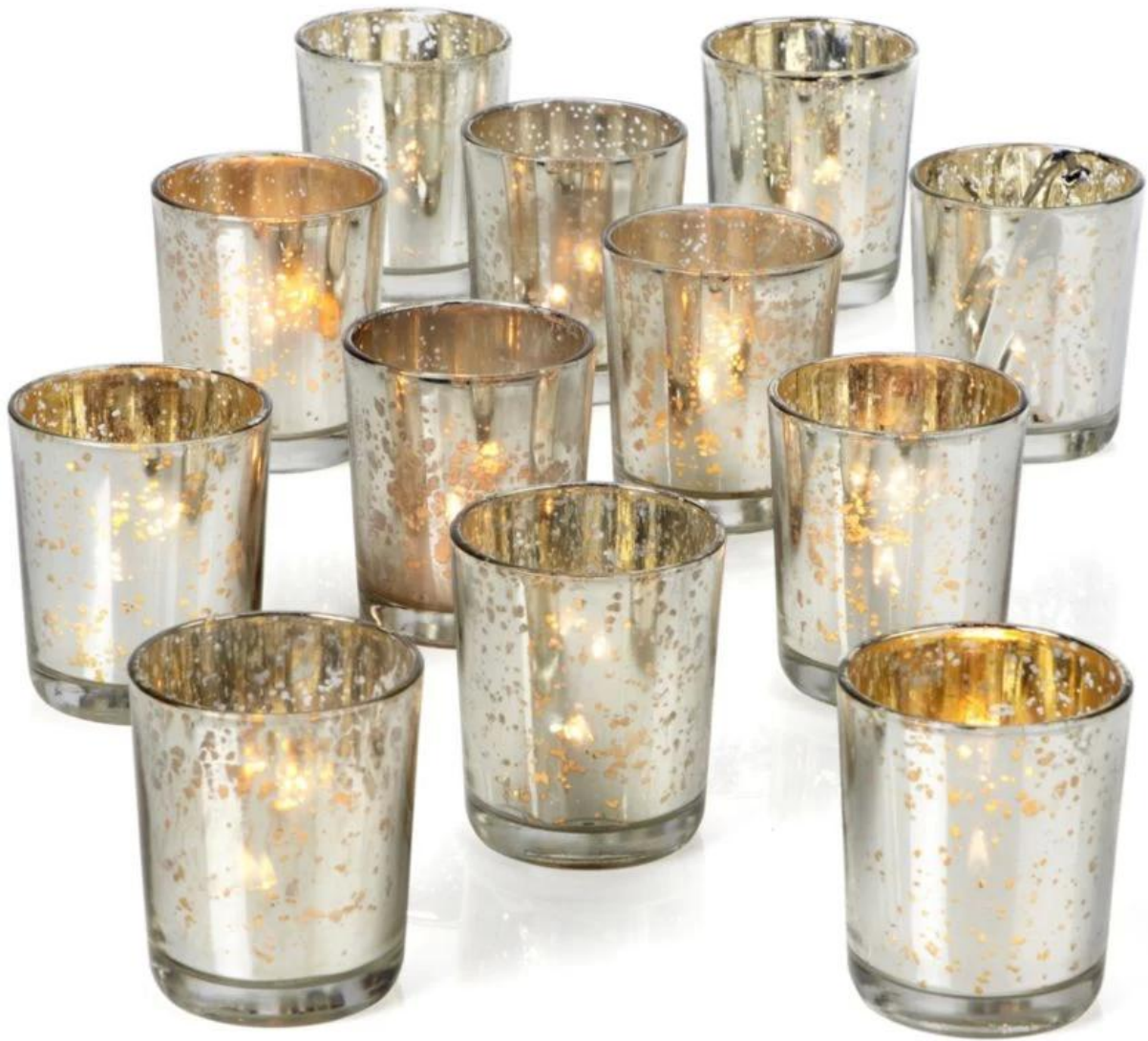
CD010 Usine de conception personnalisée de prix personnalisé usine pressée de bougeoir de mariage Chine