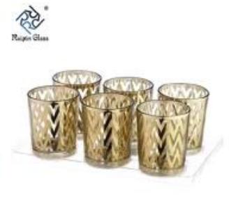
6pcs Votive Candle Holders Wedding