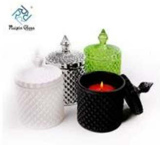
Colored Candle Jar With Lid