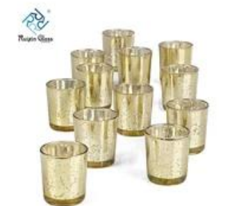
Factory Price Candle Holder 12pcs