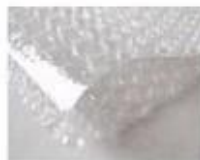
C. Bubble paper