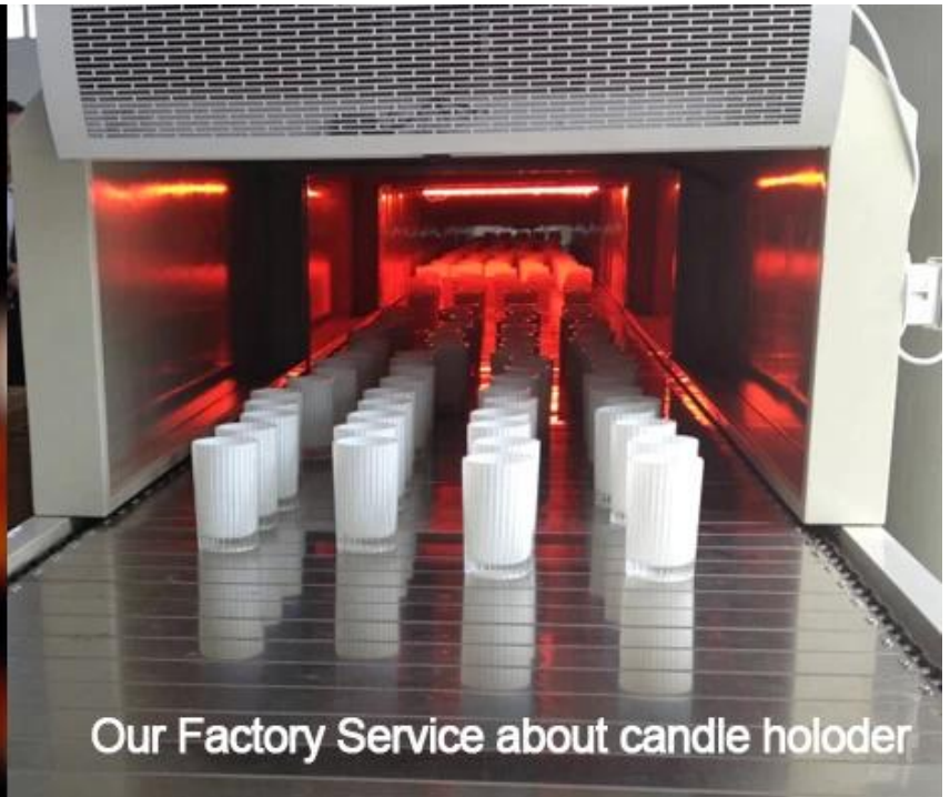
Our Factory Service about candle holder