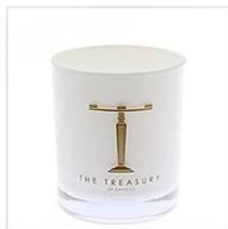
White Glass Candle Holder