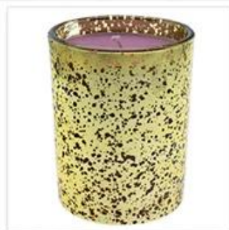
Hollow Golden Plated Glass Candle Holder