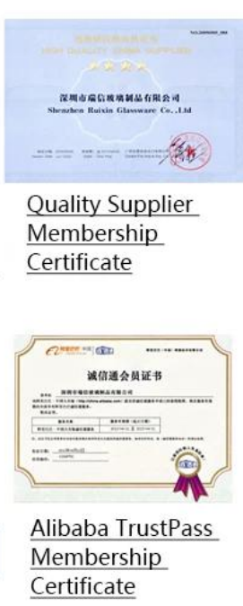
Alibaba TrustPass Membership Certificate