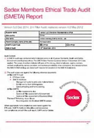
Sedex Verify factory certificate