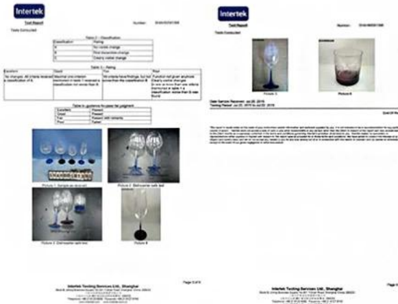
Spray glass cup dishwasher test report