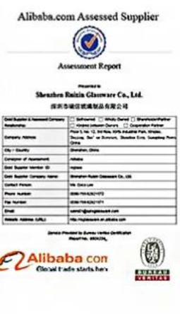
BV Verify factory