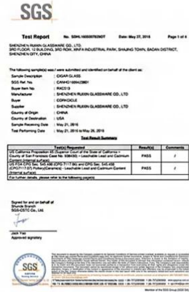
California 65 Report FDA