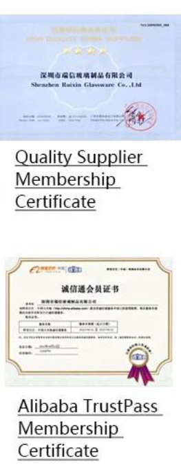
Alibaba TrustPass Membership Certificate