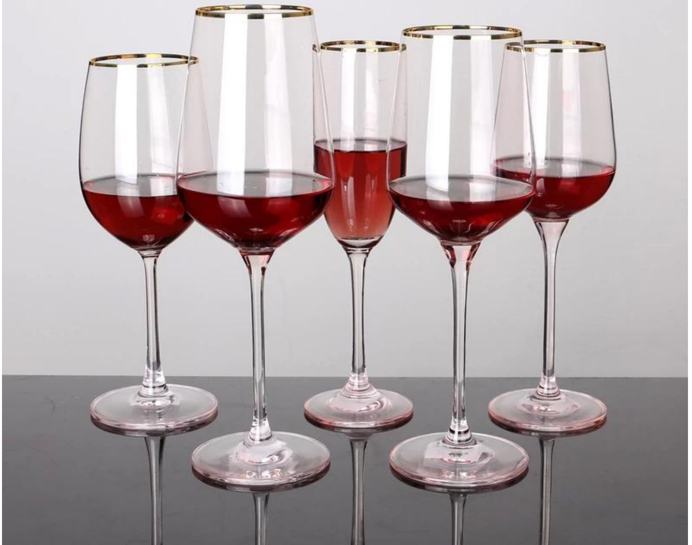
09 copas de vino personalizadas al por mayor