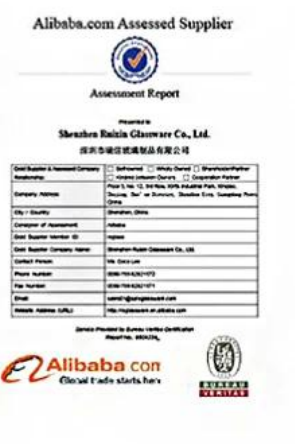
BV Verify factory