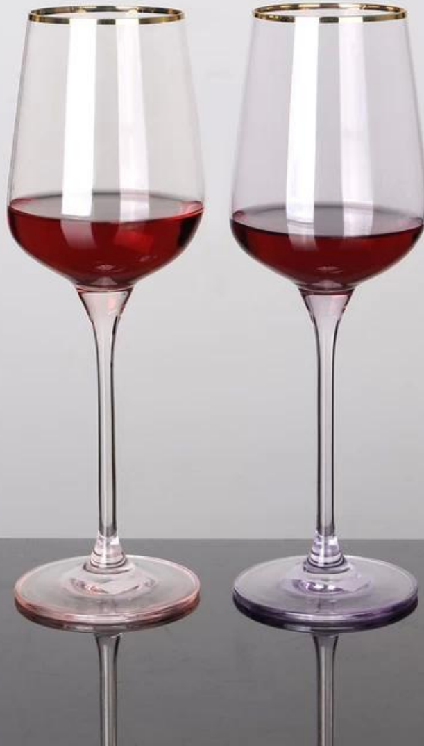
09 copas de vino personalizadas al por mayor