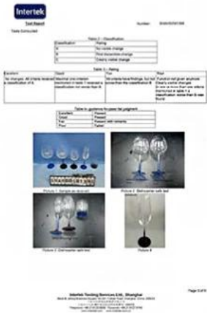
Spray glass cup dishwasher test report