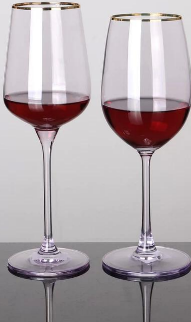
09 copas de vino personalizadas al por mayor