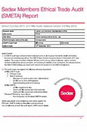
Sedex Verify factory certificate