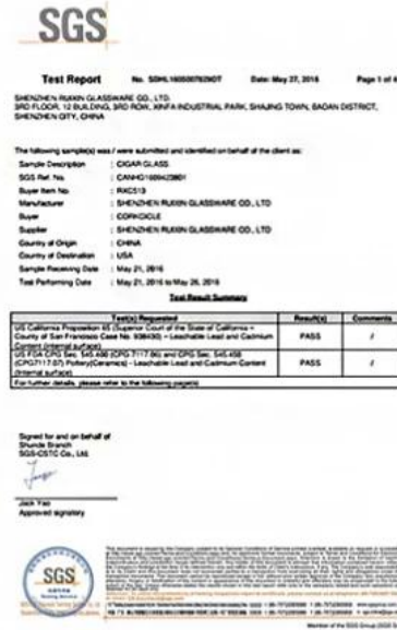
California 65 Report FDA