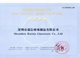
Quality Supplier Membership Certificate