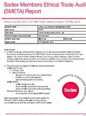
Sedex Verify factory certificate