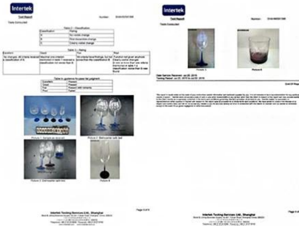
Spray glass cup dishwasher test report