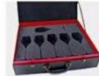
N. Gift Box