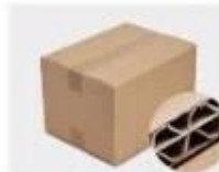
G. Five layer Corrugated paper master carton