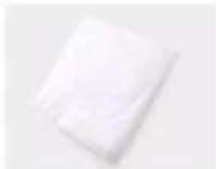
A. White paper