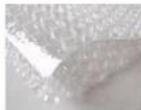
C. Bubble paper