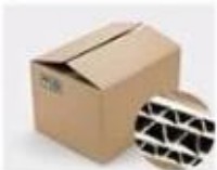
H. Seven layer Corrugated paper master carton