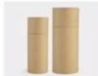
L. Paper Sleeve