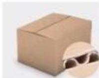
F. Three layer Corrugated paper master carton