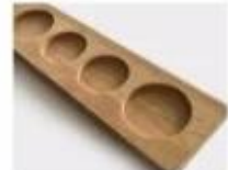
R. Wooden Pallet