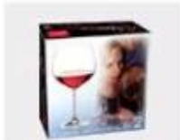
K. Color Box