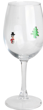
Weinglas-C Größe: 16,1*87,4*H20,1cm Kapazität: 350 ml/11,8oz Gewicht: 177,1g