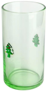
Flugball Größe: 17,7*87,7*H14,5cm Kapazität: 515 ml/14,5 Unzen Gewicht: 324,5g