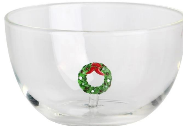
Glasschüssel-I Größe: 112,8*97*H7,5cm Kapazität: 625 ml/21,1oz Gewicht: 211g