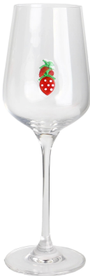
Weinglas-A Größe: 15,9*87,5*H23,5cm Kapazität: 350 ml/11,8oz Gewicht: 164,4g