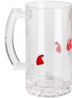
Bierkrug Größe: 18*8*H15cm Kapazität: 500 ml/16,9 Unzen Gewicht: 635g