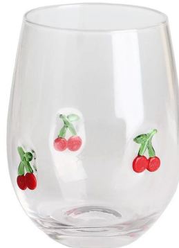
Stammloses Weinglas Größe: 17*H12CM Kapazität: 570 ml/19,3oz Gewicht: 158,6g