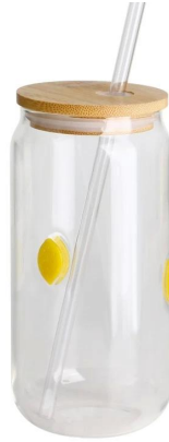
Smoothie Cup-M Größe: 16,4*8,5*H15,1cm Kapazität: 550 ml/18,6 Unzen Gewicht: 157,1g