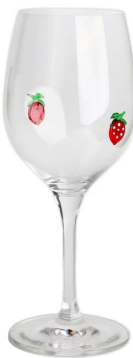
Weinglas-D Größe: 16,9*88*H21,9cm Kapazität: 475 ml/16oz Gewicht: 175,2g