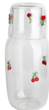
Wasserkrug Größe: T8.4*B7.4*H22.4cm Kapazität: 1120 ml/38oz Gewicht: 530g