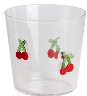
Glas Jar-C Größe: T8.5*B6.5*H8.2cm Kapazität: 295 ml/10oz Gewicht: 103,5 g