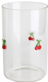
Glas Jar-a Größe: T6.5*B6.5*H10CM Kapazität: 325 ml/11oz Gewicht: 140g