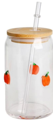
Smoothie Cup-S Größe: 16,7*8,2*H12,4cm Kapazität: 440 ml/14,9oz Gewicht: 204,5 g