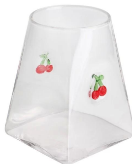
Gewürz Jar-I Größe: T7*B6.9*H11.4cm Kapazität: 510 ml/1.7oz Gewicht: 268,2g