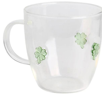
Kaffeetasse Größe: 11,7*8*H10cm Kapazität: 495 ml/16,7oz Gewicht: 140,1g