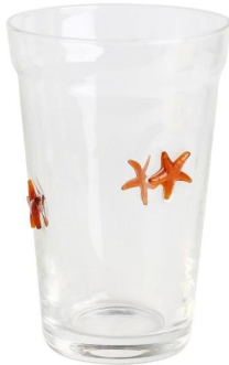
Becher Größe: 18,5*8,5*H13cm Kapazität: 380 ml/12,8 Unzen Gewicht: 226,3g