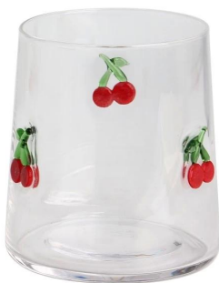
Gewürz Jar-S Größe: T8.5*B7.8*H8.6cm Kapazität: 290 ml/9.8oz Gewicht: 130g