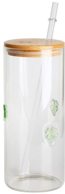
Smoothie Cup-L Größe: 17,5*8,5*H17,5cm Kapazität: 655 ml/22,1oz Gewicht: 262,8g