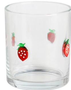
Kerzenglas Größe: 17*86,5*H8,7cm Kapazität: 270 ml/9,3oz Gewicht: 165g