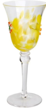
Kelch Größe: 18,5*87,4*H20,1cm Kapazität: 210 ml/7,1oz Gewicht: 193,5g