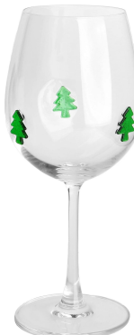
Weinglas-B Größe: 17*88,3*H22,4cm Kapazität: 565 ml/19oz Gewicht: 218,3g