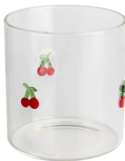
Glas Jar-B Größe: T6.5*B6.5*H6.5cm Kapazität: 185 ml/6oz Gewicht: 120g