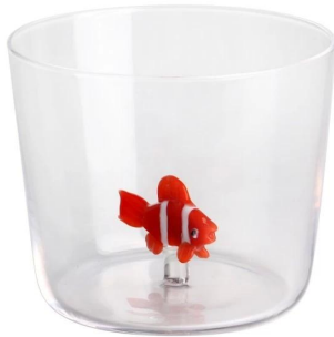
Glasschalen-S Größe: 110,3*86,2*H8,6cm Kapazität: 500 ml/16,9 Unzen Gewicht: 164,3g