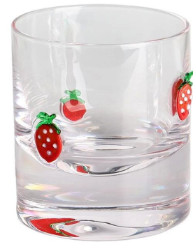
Whiskyglas Größe: 17,9*87,8*H9CM Kapazität: 230 ml/7,8oz Gewicht: 516,4g