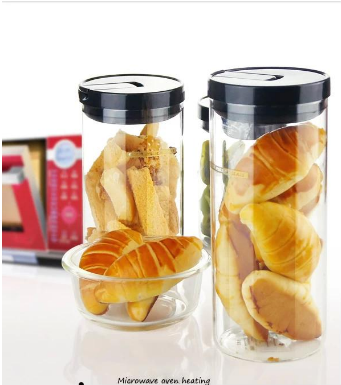
• Microwave oven heating