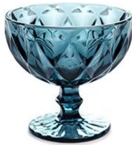
Diamond - blue