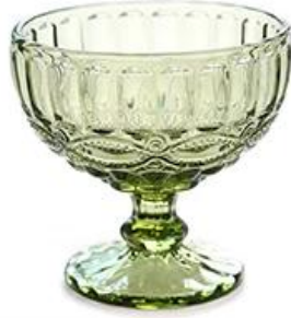
Pattern - green