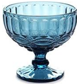
pattern - blue