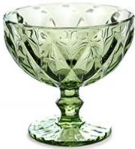
Diamond - green