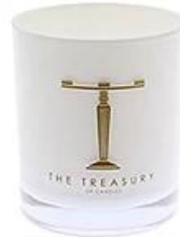
White Glass Candle Holder