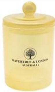
Glass Candle Jar