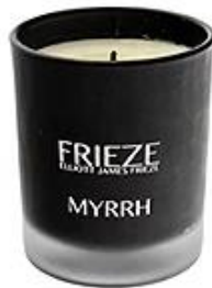
Black Frosted Glass Candle Holder