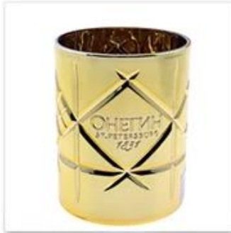
Golden Plated Glass Candle Holder