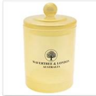
Glass Candle Jar