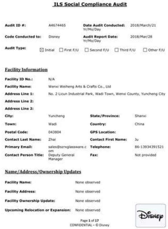
Audit Report revised on Disney