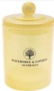
Glass Candle Jar