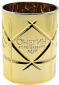
Golden Plated Glass Candle Holder