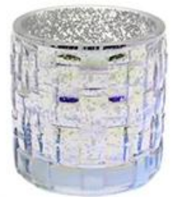
Glass Candle Holder with Hollow Plated and Colorful