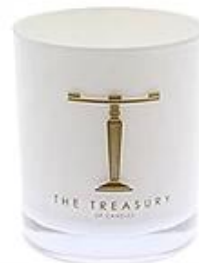
White Glass Candle Holder