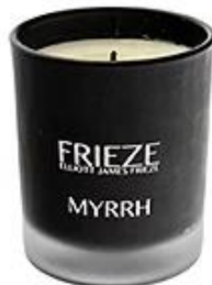
Black Frosted Glass Candle Holder