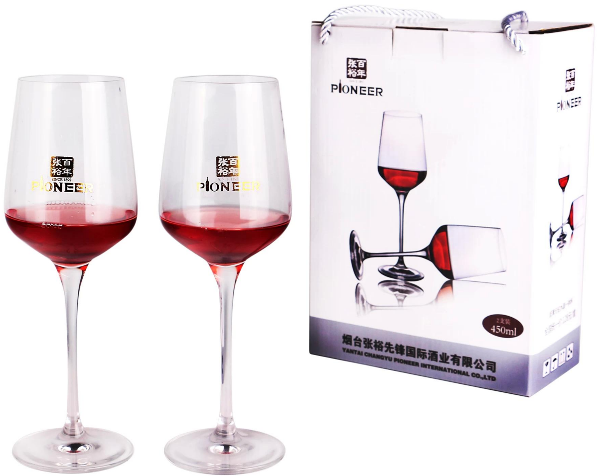
06 Kundenspezifische Weingläser Kein Minimum