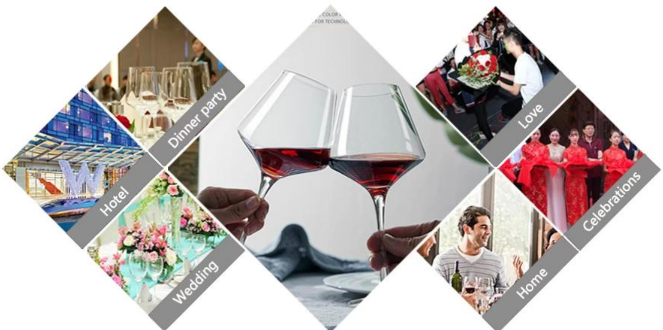
01 Farbige Weingläser zum Verkauf