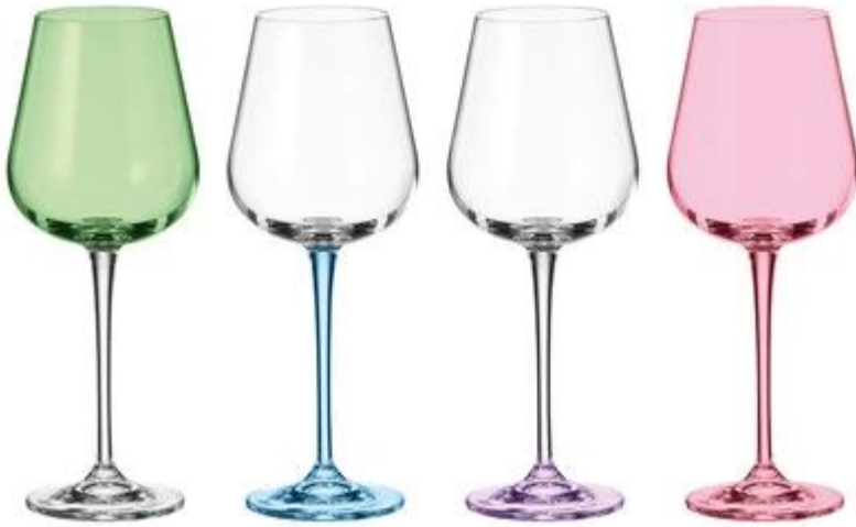
01 Farbige Weingläser zum Verkauf