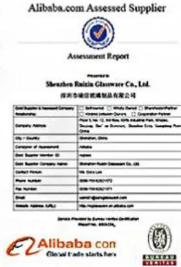
BV Verify factory