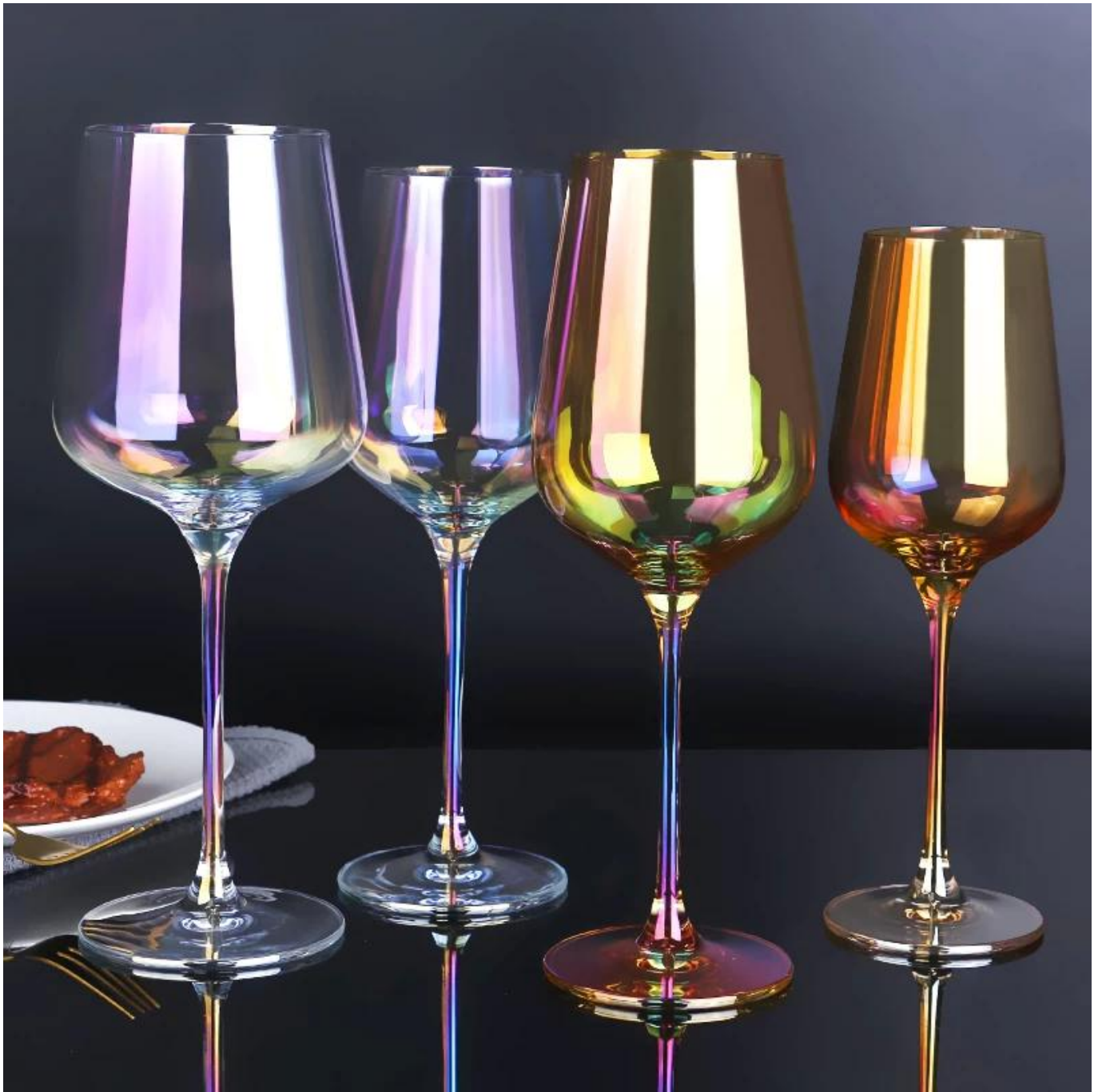
01 Farbige Weingläser zum Verkauf