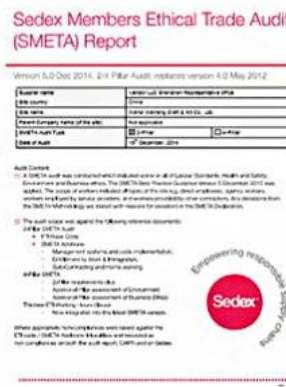
Sedex Verify factory certificate