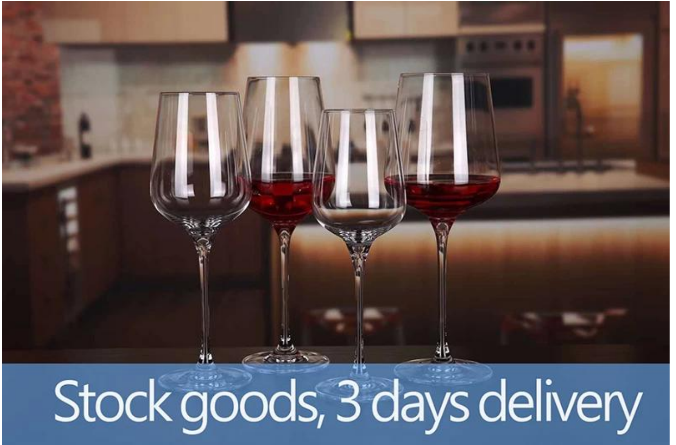
01 Farbige Weingläser zum Verkauf