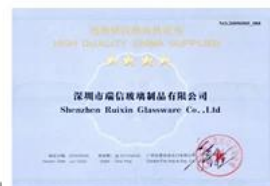
Quality Supplier Membership Certificate