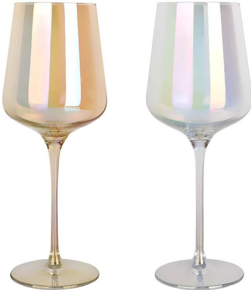
01 Farbige Weingläser zum Verkauf