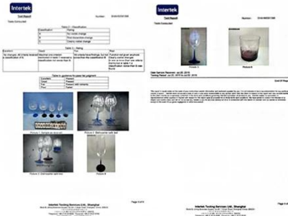
Spray glass cup dishwasher test report