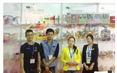
01 Farbige Weingläser zum Verkauf