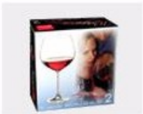
K. Color Box