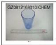
SGS Reference for this report: 060224-010 17 Oct 2014