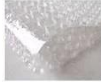
C. Bubble paper