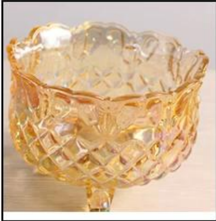
Floral Edge Design

The fruit are clear and transparent Fashion home art taste You deserve to have.