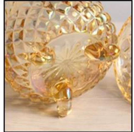
Trigonal Bottom Design