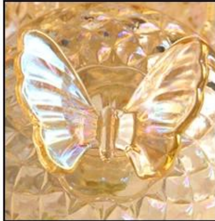
Papilionaceous Lid Design