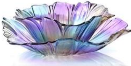
【 Bright 】