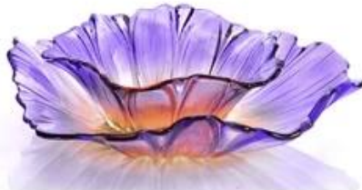
【 Purple 】