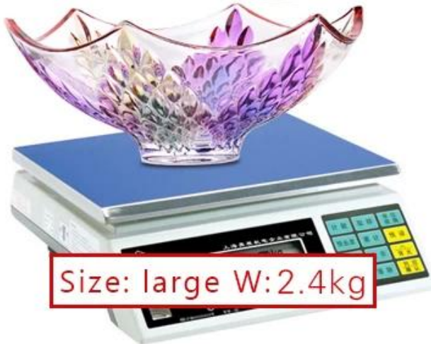
Size: large W:2.4kg