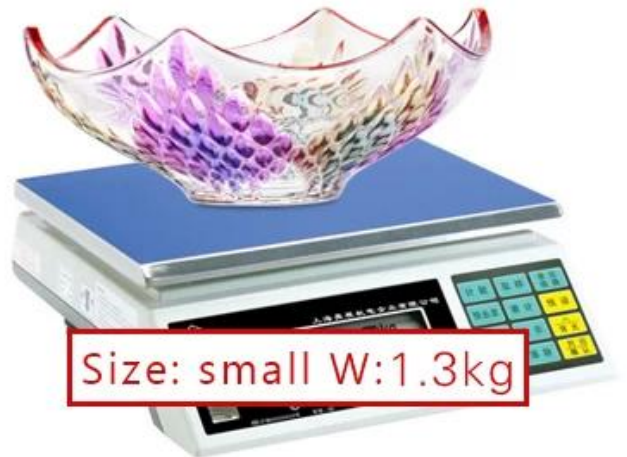
Size: small W:1.3kg