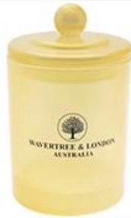
Glass Candle Jar