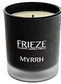
Black Frosted Glass Candle Holder