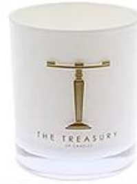
White Glass Candle Holder