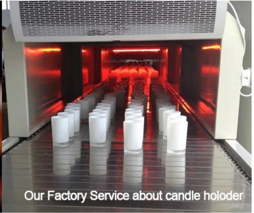
Our Factory Service about candle holder