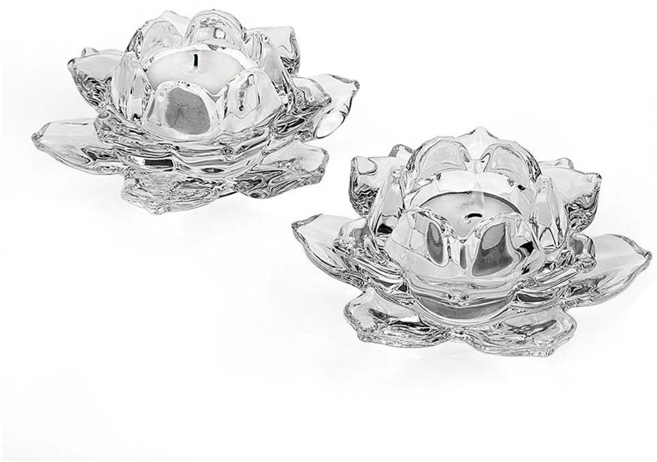
كريستال الزجاج شمعدانات عرض المنتجات