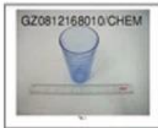
SGS Reference for chemical analysis report 1717 17 Dec 2014