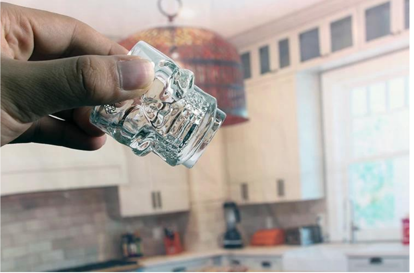
شريط، الجمجمة، طلقة الزجاج